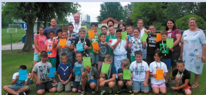
A táborozók I. csoportja, akik a táborozás emlékére boldogan vették át az oklevelet és az érmet

Idén sem maradhatott el a nagy melegben a fürdőzés a Liza Aqua & Conference Hotel strandján, a táborozók kerékpárral jutottak el a helyszínre