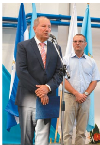
...Lajosmizse Város Településfejlesztéséért díjat Lajosmizsei Folplast Kft. és a Freudenberg Tömítés Ipari Kft. kapta.