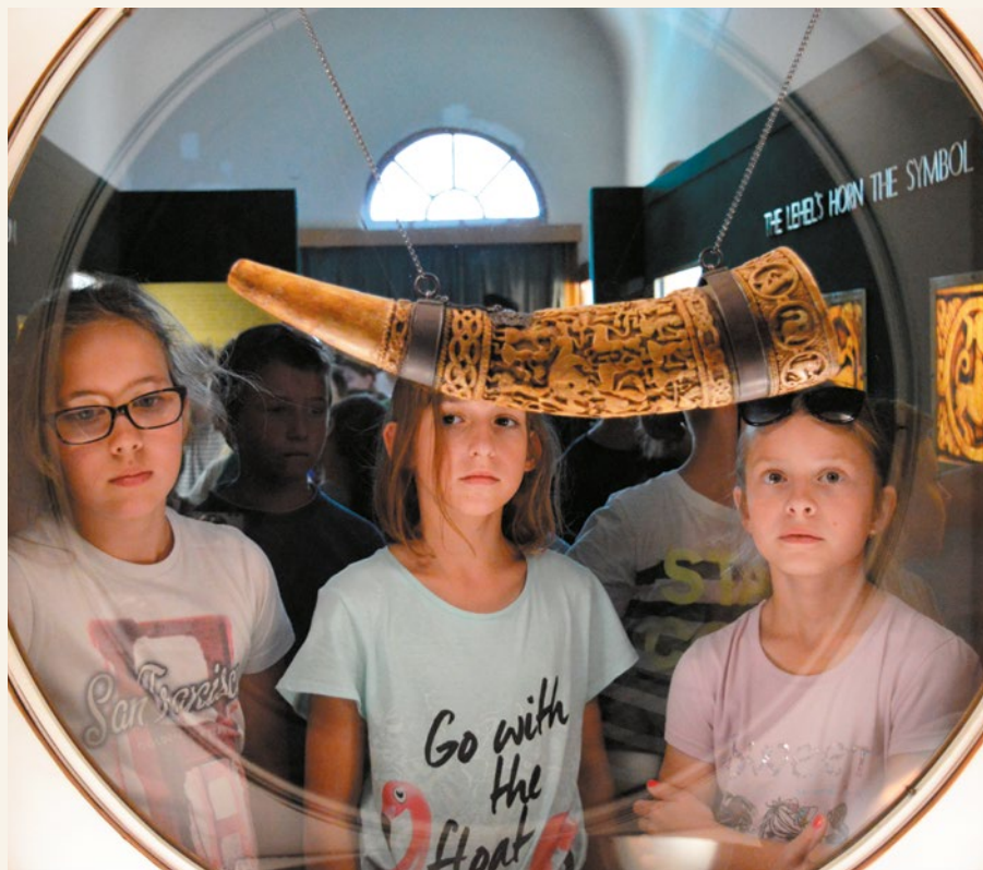
Fontosnak tartjuk, hogy a jáász hagyományokat is életben tartsuk, ill. örökössük az új generációk számára is. (Jászberény, Jász Múzeum)