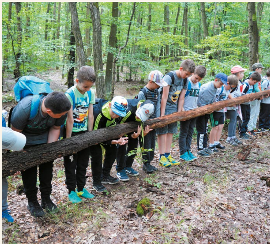
Az idei Fürkész tábor ismét tartalmas és változatos programokat kínált a gyerekeknek. (Katalinpuszta, kirándulóközpont)