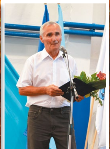
...Lajosmizse Város Sportjáért díjat az Almavirág Horgász Egyesület...,